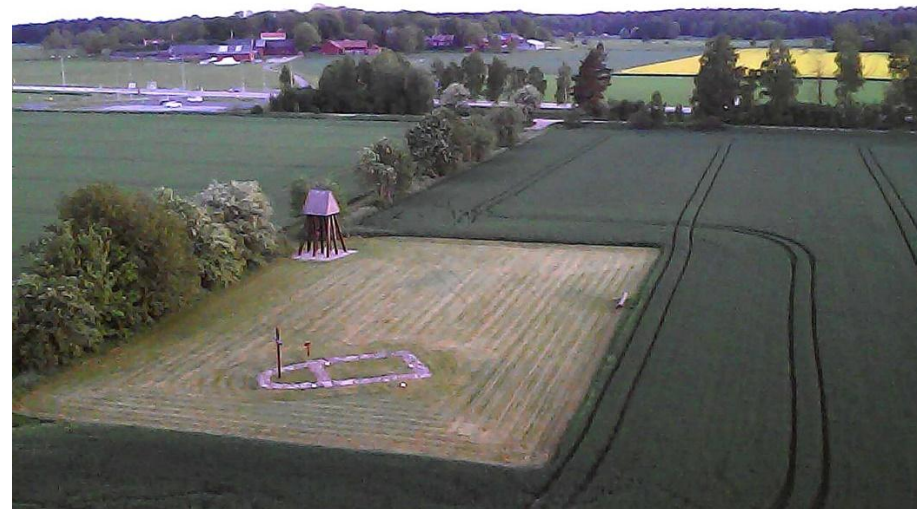
Kapellgården nordost om Karleby, nära ån Tidan.